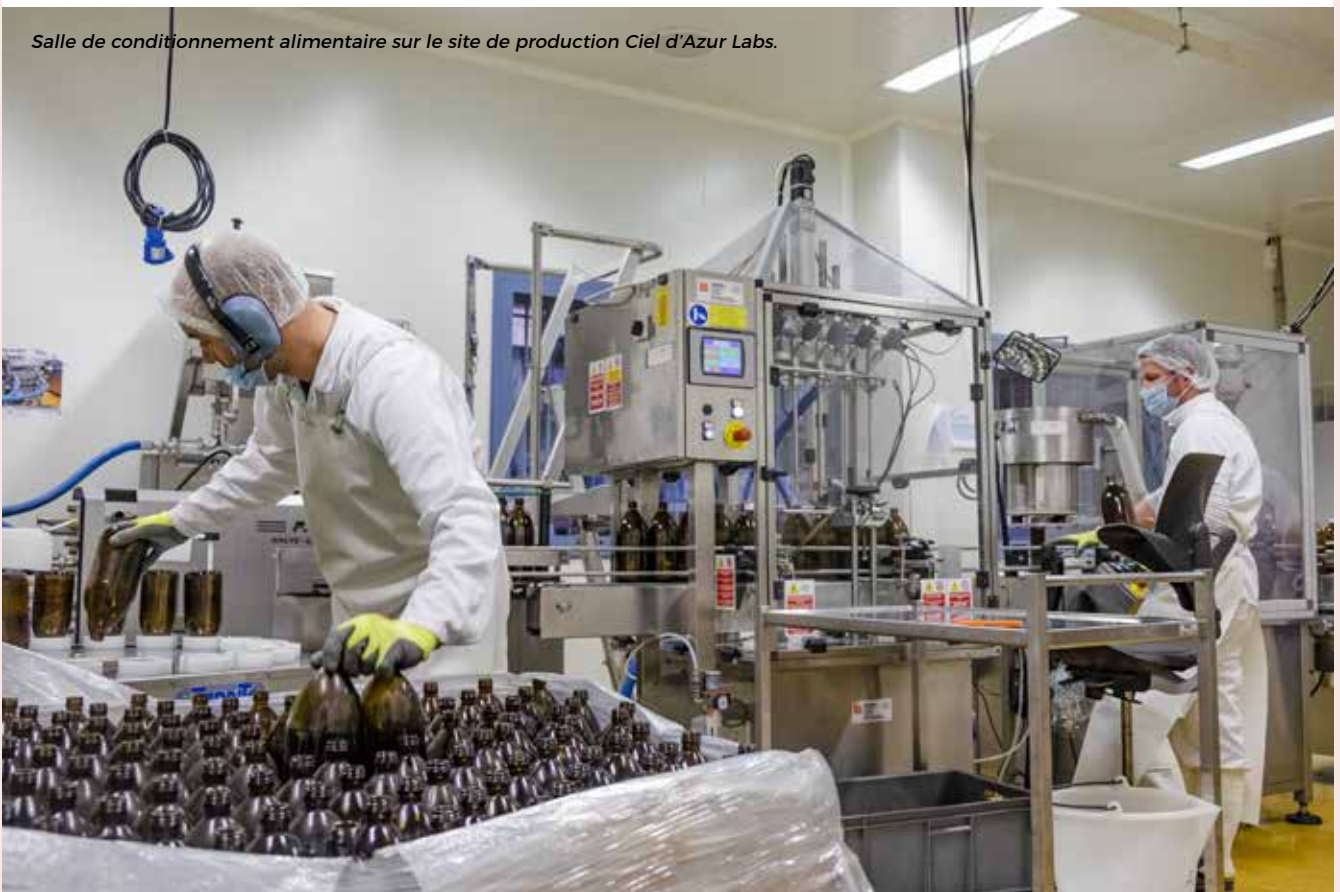
Salle de conditionnement alimentaire sur le site de production Ciel d'Azur Labs.

Seul fabricant de produits aux aloès en France avec sa marque Pur'Aloé, Ciel d'Azur Labs maîtrise sa production depuis la culture jusqu'aux produits finis. L'entreprise réalise 97 % de son chiffre d'affaires sur le territoire national. Elle entend aujourd'hui se développer à l'export. Si la Belgique est à ce jour sa principale partenaire à l'international, l'entreprise envisage de se déployer prochainement dans d'autres pays européens et d'investir également les marchés asiatiques, canadiens et américains.