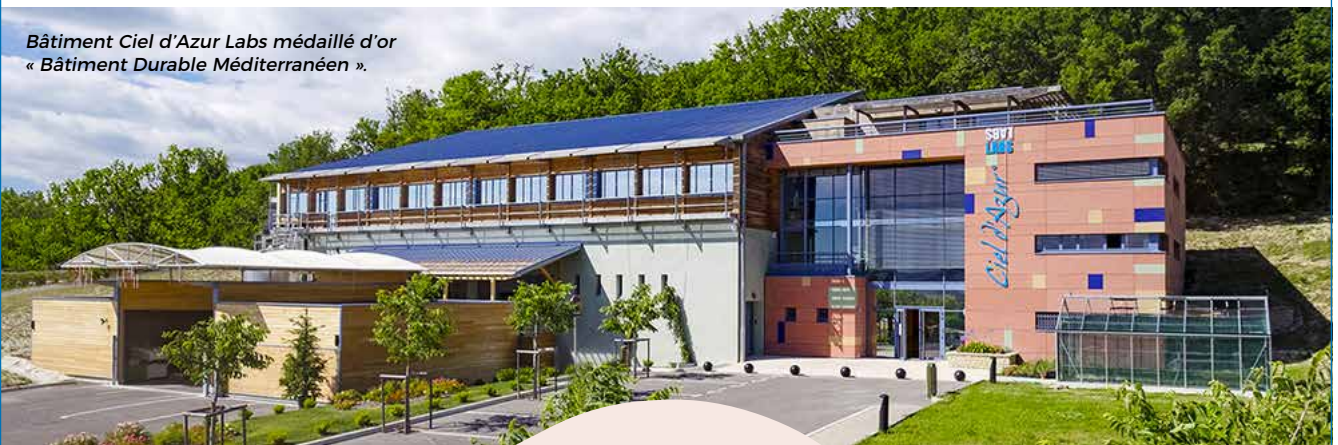
Bâtiment Ciel d'Azur Labs médaillé d'or « Bâtiment Durable Méditerranéen ».

L'utilisation du dénivelé du coteau a été utilisée pour l'intégration de la volumétrie générale du bâtiment. Ce dernier a été conçu de sorte à différencier les 3 fonctions essentielles : socle massif maçonné à l'ouest pour le stockage des produits, superstructure à ossature bois pour la production à l'étage, largement ouverte sur le paysage, tandis que la partie accueil et bureaux s'organise depuis un hall atrium distribuant les 3 niveaux. Un toit végétalisé sur lequel se trouve une terrasse a encore été aménagée pour recevoir l'accueil du personnel dans une superstructure en ossature bois. Enfin, l'utilisation de la géothermie (chauffage et refroidissement), l'utilisation des énergies nouvelles (photovoltaïque) in situ et, prochainement, la récupération des eaux de pluie devraient permettre d'améliorer la production de l'énergie électrique du bâtiment. Aujourd'hui, cette production n'atteint que 30%, mais elle sera bientôt améliorée par la construction d'une nouvelle serre de 1 000 m 2 intégrant des panneaux photovoltaïques. L'objectif à moyen terme : rendre le bâtiment passif.