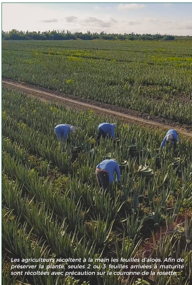
Les agriculteurs récoltent à la main les feuilles d'aloès. Afin de préserver la plante, seules 2 ou 3 feuilles arrivées à maturité sont récoltées avec précaution sur la couronne de la rosette.