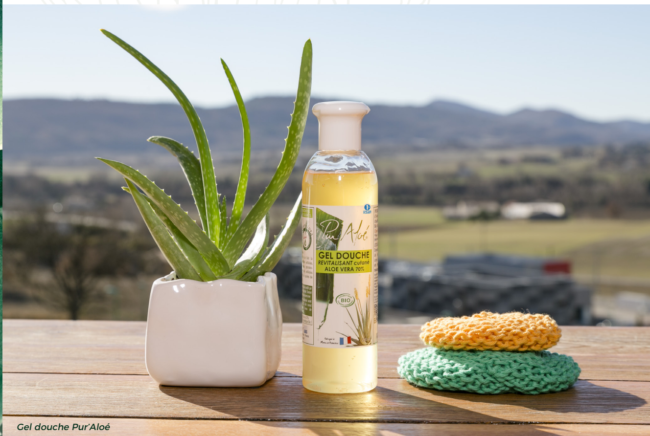
Gel douche Pur'Aloé

L'aloé vera et l'aloé arborescens sont des liliacés qui poussent dans les pays tropicaux secs. Lorsque l'on découpe une feuille, on découvre une pulpe charnue qui permet à la plante de survivre durant les longues périodes de sécheresse et qui est d'une richesse thérapeutique étonnante.